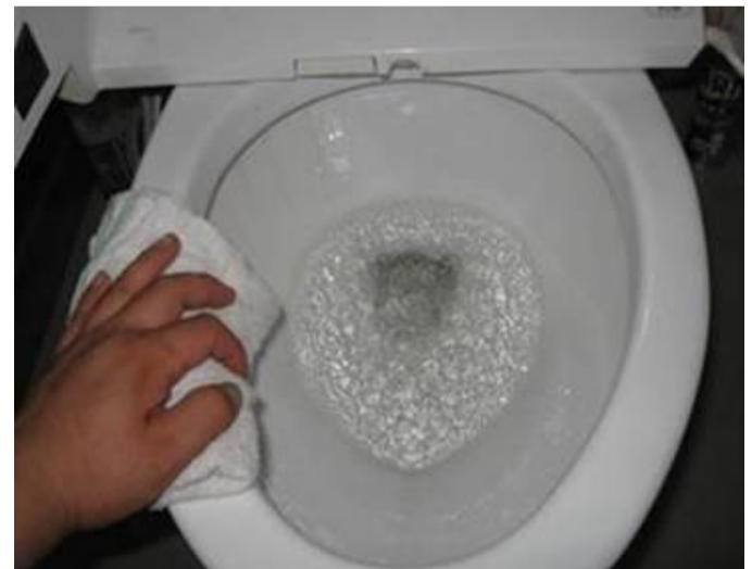
排水後拭き上げを実施しました。