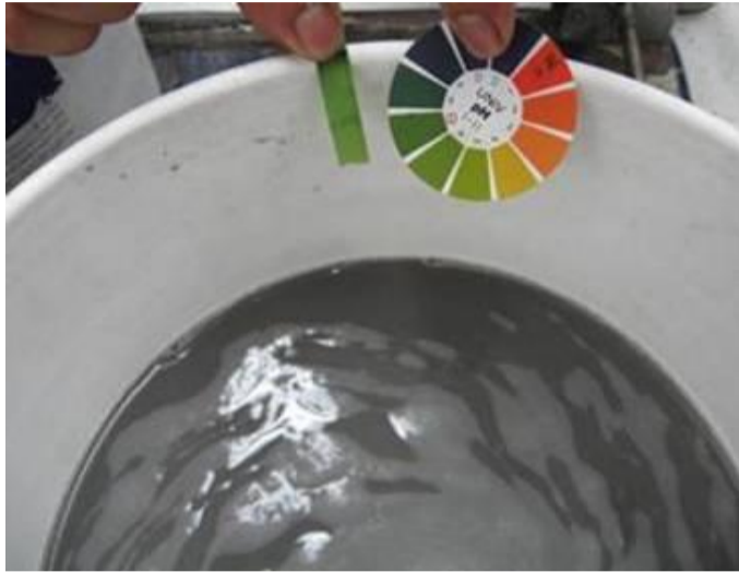
リトマス紙にて液性をチェックしながら中和しています。