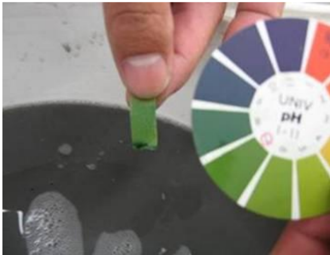
リトマス紙にて液性をチェックしながら中和しています。