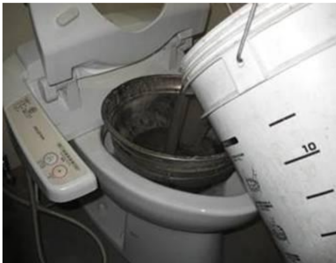
中性になったところで排水致しました。