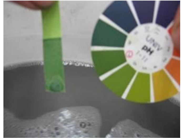
リトマス紙にて液性をチェックしながら中和しています。